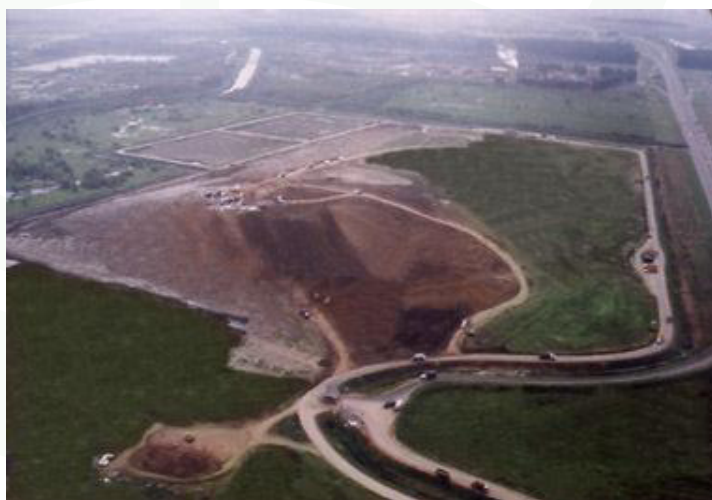
Flyfoto av Norte III- området

Gjennom prosjektet reduseres de globale CO 2 -utslippene med rundt 150 000 tonn CO 2 -ekvivalenter/år 1 .